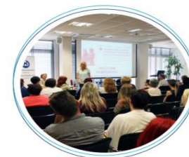
Be part of our story