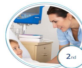
2nd Bologna Cycle Study Programs Nursing Care Health Promotion