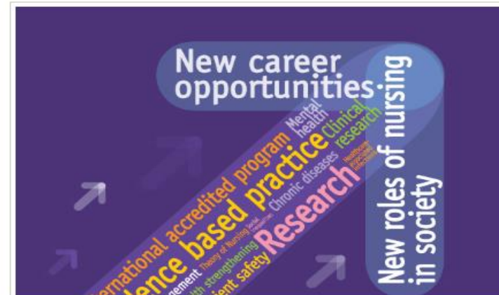
2nd Bologna Cycle Advanced Nursing Care