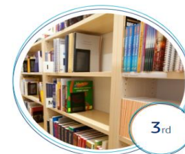
3rd Bologna Cycle Study Programs Health Care Sciences Doctoral Study