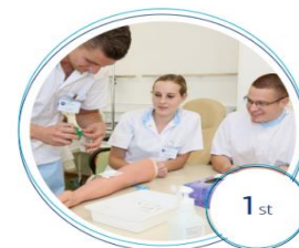
1st Bologna Cycle Study Programs Nursing – curricular reform 2016 Physiotherapy

Learn about our study programs and join us at ABFHC