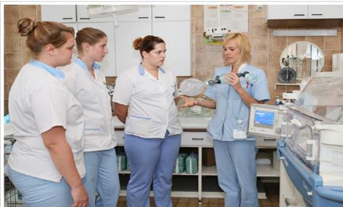
1st Bologna Cycle Nursing Care Study program