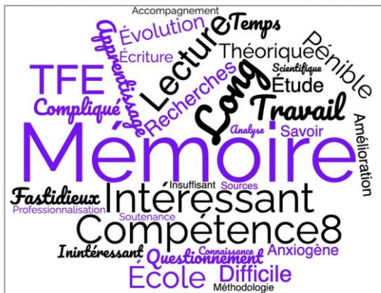
ESI du groupe 1 : Représentations sociales de la formation à la recherche en IFSI