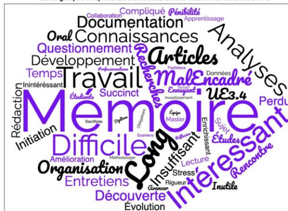
ESI du groupe 2 : Représentations sociales de la formation à la recherche en IFSI